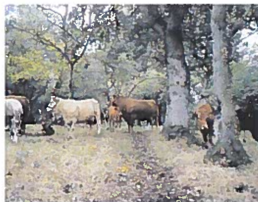
Langø Egeskov, Midtjylland.