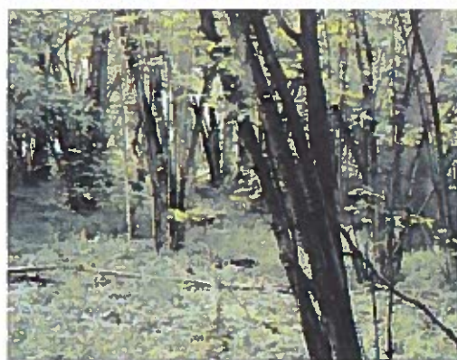
Vesterskov, Østjylland.