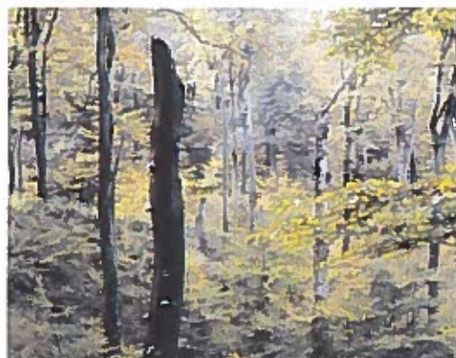
Velling Skov, Midtjylland.